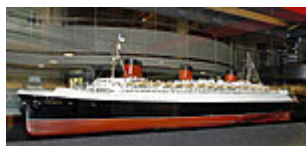
Une maquette de Normandie

● Les grandes phases de l'évolution technique et humaine des industries navale et aéronautique à Saint-Nazaire sont retracées avec la présentation de maquettes de navires célèbres dont Normandie (1935) et France (1962), des maquettes de soufflerie des premiers hydravions Loire des années 1930. La ville d'avant-guerre, puis celle de la reconstruction avec l'histoire de ses habitants sont représentées par des films d'archives et des documents inédits.