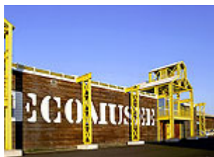
Le bâtiment de l'Ecomusée

● Voyage dans l'histoire de la ville et du port