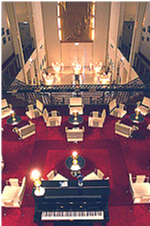
Bienvenue au bar d'Escal'Atlantic !