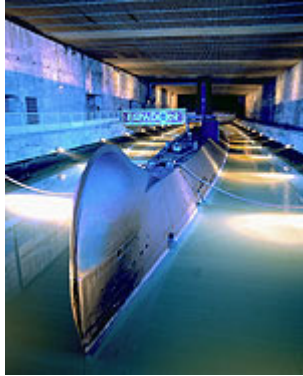
Le sous-marin dans l'écluse